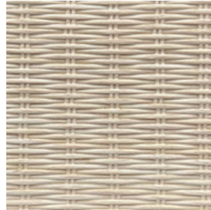
Eiche hell Fineline Furnier