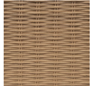
Nussbaum Fineline Furnier