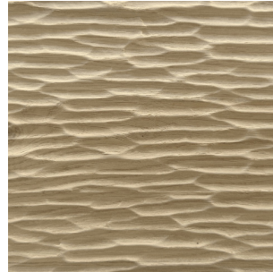
Asteiche Echtholz furnier