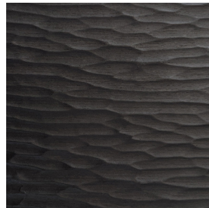
Schwarz Fineline Furnier