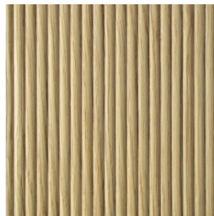
Asteiche Echtholz furnier