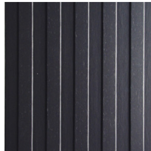
Schwarz Alpi Furnier