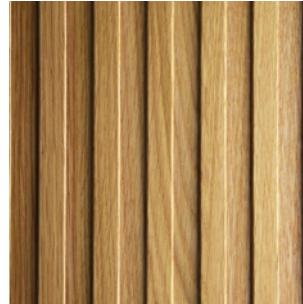
Asteiche Echtholz furnier

Verprägung: beidseitig Tiefe der Verprägung: 2,5 mm