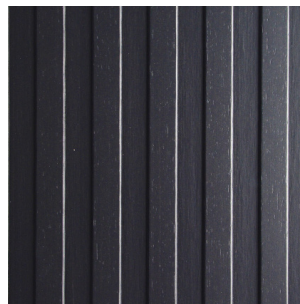
Schwarz Finline Furnier