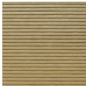
Asteiche Echtholz furnier