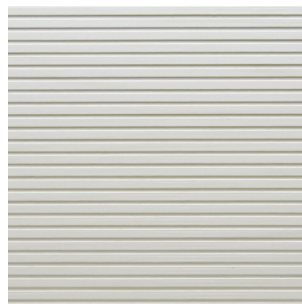
Weiss Alpi Furnier