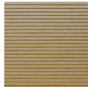
Eiche hell Alpi Furnier