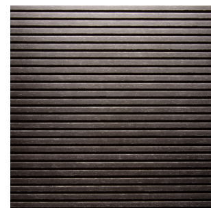
Schwarz Alpi Furnier