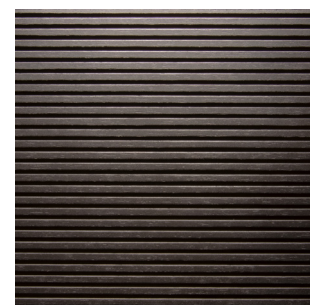
Schwarz Alpi Furnier