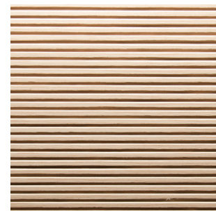
Eiche hell Alpi Furnier