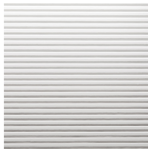
Weiss Alpi Furnier