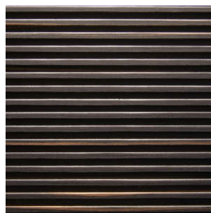
Maro Ebenholz Alpi Furnier