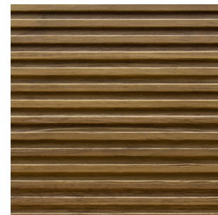
Kernnussbaum Echtholz furnier