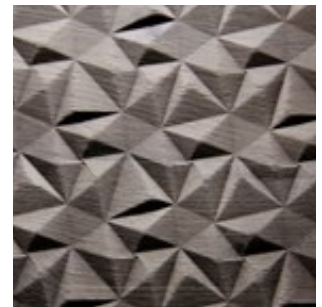
Eiche grau Echtholz furnier