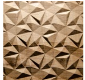
Asteiche Echtholz furnier