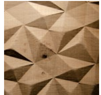
Asteiche Echtholz furnier