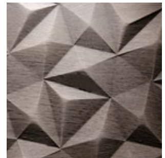
Eiche grau Echtholz furnier